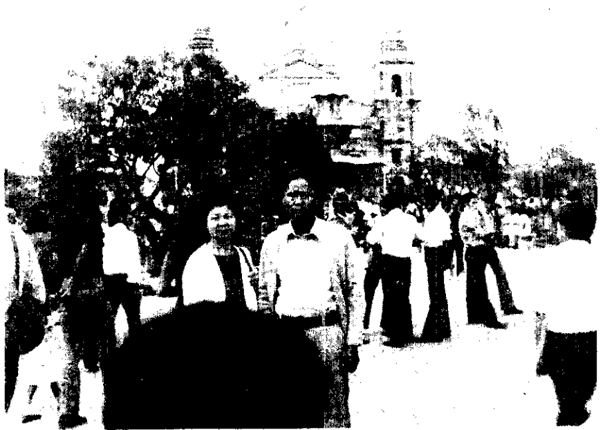
總統府附近的公園