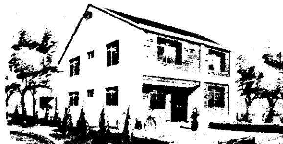
農民住宅標準設計圖 204型及內部平面圖