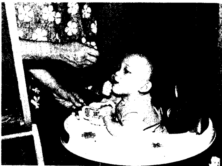
一個孩子好照顧 (吳傳德)

總之，生命的意義不只是傳宗接代，生活的目的，更非貪求一己的舒適，我們實施家庭計畫，就是要放遠眼光，給下一代一個更美好的生活環境。