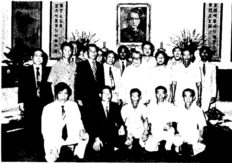
蔣總統在總統府約見全國農、漁民代表並與他們合影。