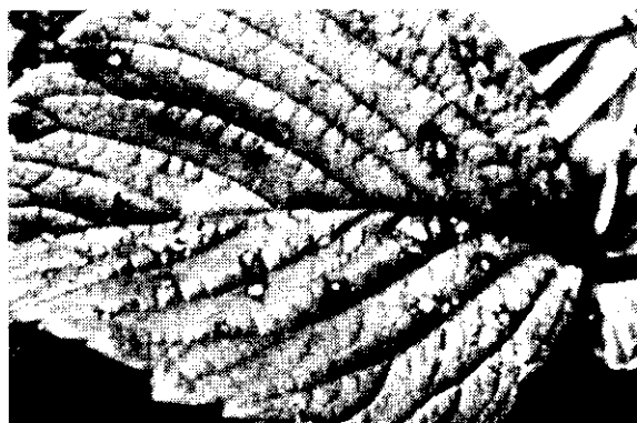
輪紋病：病斑由葉緣開始