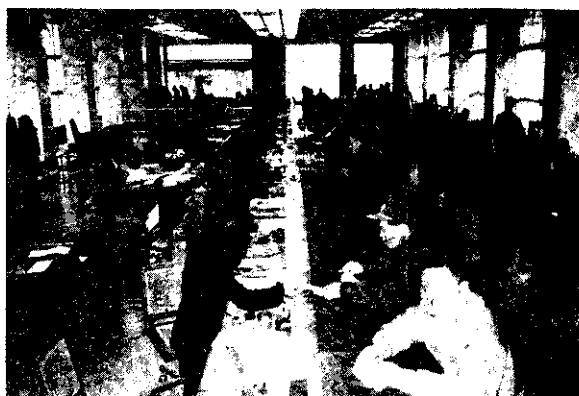
農會信用部作業情形