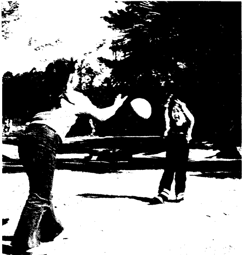
姊妹妹妹好遊戲(阿郎)

我們應該共同來關心自己的人口問題，共同負起家庭計畫的責任，爲國家及後代子孫，創造光明前程。