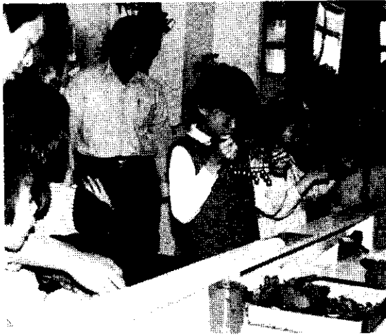
父母應多帶兒女參觀博物館(阿郎)