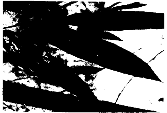
蚜虫類為害易引發煤病

又名竹姬角蚜，是竹林間最常見的1種害虫，多羣集於葉背取食，並分泌蜜露，誘發煤病，影响竹林成長。棲羣變動以每年夏季密度最低，直至秋季10月間開始逐漸增高。