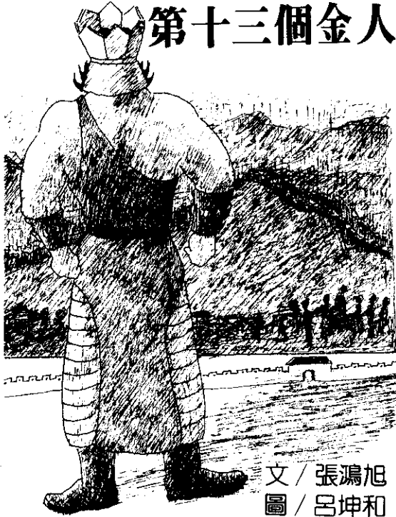
文 / 張鴻旭 圖 / 呂坤和

秦始皇時代，咸陽城內的百姓個個充滿了緊張的神情，有的交頭接耳，有的唉聲嘆氣，因為大隊的官兵又來傳達命令，凡是收藏有各種兵器的人家，必須要全部交出。