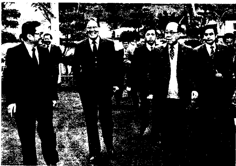
謝副總統與省府李主席參觀台灣電影製片廠。

農發會說，去年 12 月初行政院衛生署曾在國內零售市場以抽樣方式購取 10 件秋刀魚，經化驗結果，有兩件檢查不出有含汞量，其餘 8 件魚肉部分的含汞量，在 0.005~0.095 PPM，內臟部分的含汞量在 0.021~0.165 PPM，遠較安全食用衛生標準的 0.5 PPM 為低。去年 12 月中旬，國內業者主動向台灣省水產試驗所提供秋刀魚樣品，申請化驗，結果與衛生署所公佈者極為接近。