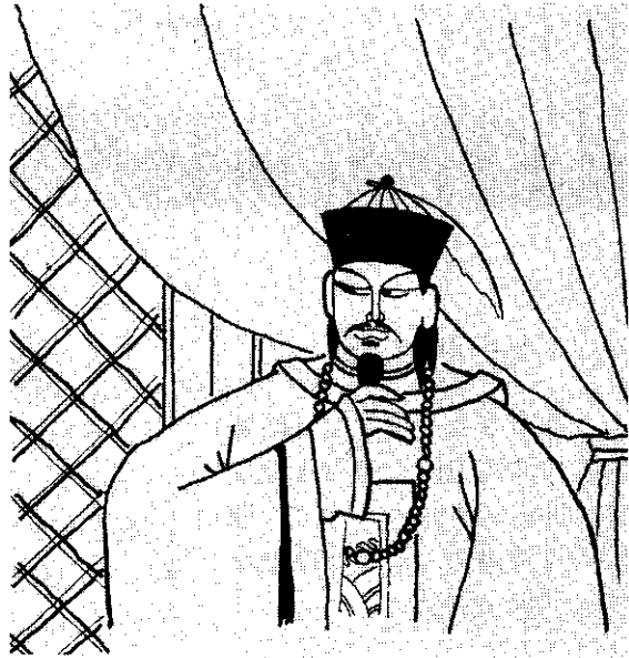
王爺，把事情交給我好了。

然從帳外衝進一批刀斧手來，人人如狼似虎，個個貌如兇神，進帳不問情由，舉刃便向妖僧們猛砍。頃刻之間，血濺華