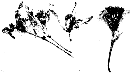
左：畸型綠花 右：健全花

失在50%以上，嚴重者發病率達60~90%。所以如何全面防止本病的蔓延，實為當務之急。