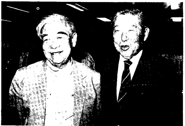
中央研究院新任院長吳大猷(左)與另一候補人閻振興

省府表示，本年二期稻作的產量，較去年同期減少4%，但去年是歷年產量的最高峯，如與70年同