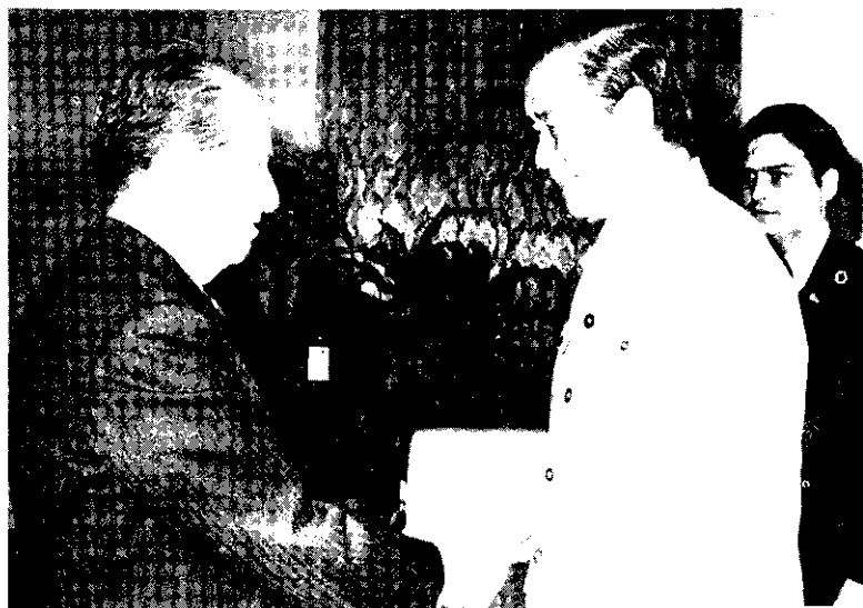
行政院長孫運璿接見玻利維亞前總統現任駐西班牙大使西萊斯(Luis Adolfo Siles Salinas)

農發會說：本年度台灣沿岸漁業資源保護及培育計畫的經費總額為新台幣800萬元，其中由該會在加強農建方案下補助425萬元，漁業發展基金會補助150萬元，台灣省漁業局配合100萬元，餘125萬元由有關縣政府與區漁會負擔。