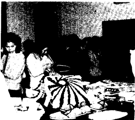
台北縣家政手工藝展覽會(卅月正)

紫： 象徵高貴、神秘、莊重、憂鬱、柔和、蕭條。一般說來紅紫色較適宜年青人，藍紫色適合中年人，鮮紫色只宜做晚禮服或膚色白的中年人；紫色最適宜與白色相配合。春天宜用淡紫色，夏天宜用紅紫色，秋天宜用深紫色，冬天則不宜用。