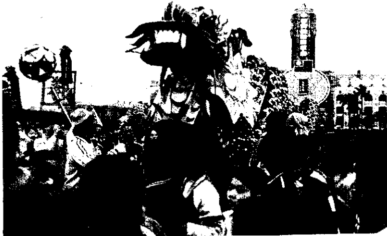
慶祝中華民國73年元旦，全國各界人士15萬人，參加清晨在總統府前舉行的升旗典禮，並作民俗遊藝表演。