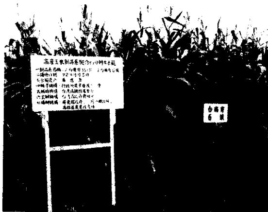
稻田轉作玉米示範（楊文振）

(2)不整地播種：前作物收成後，先噴酒殺草劑，用機械築畦，雙行穴播種玉米。方法是依行距70公分