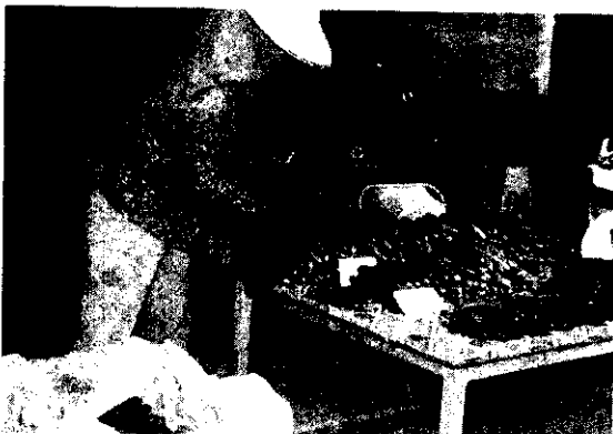
里港鄉農會集貨場，分級包裝情形。