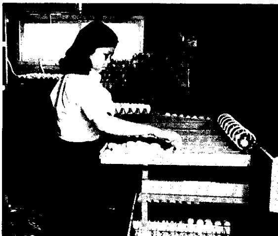
孵化前選蛋 (林吉郎)

(2)種蛋需放在陰涼室內，存放期間最好不要超過10天，如放冷氣房內，溫度18°C時，可放兩星期，放的時間越久，孵化率越差。(簡明龍)