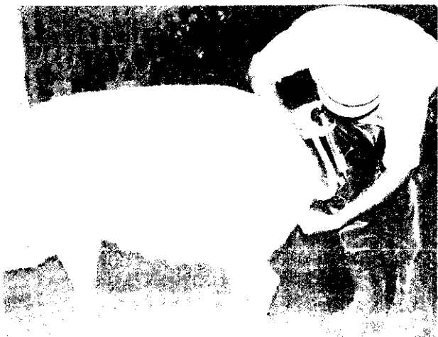
豬人工授精兼獸醫人員