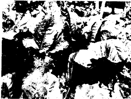
農林廳鼓勵養豬農友種植苜蓿菜