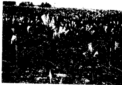
圖一：萌芽率達百分之百