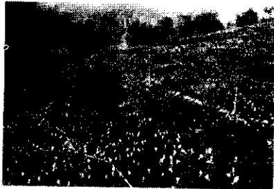
圖二：花芽密密麻麻