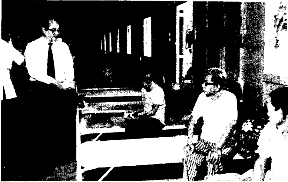
農林廳長余玉賢訪問新加坡老人院，分贈省產椪柑。