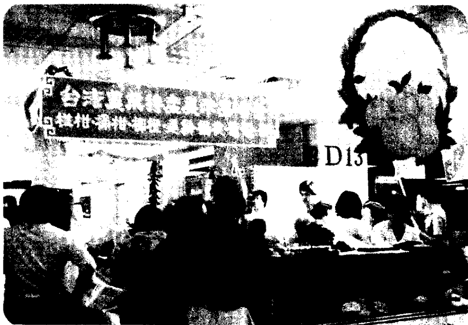
台灣農業特產展示品嘗會，元月13~15日在新加坡舉行。

我在今年元月間，到馬來西亞的吉隆坡、檳城及新加坡與香港，了解省產水果在當地的產銷情形。茲將所見所聞，和我個人的看法，報告於下。