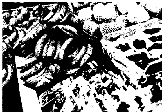
新加坡市場上水果充裕。香蕉是美國戴爾蒙多公司在菲律賓生產輸往的。

省產柳丁在民國60年左右，曾經橫掃東南亞市場，但近年來已經淪落到每年只外銷數千箱的地步，主要原因是美國、澳洲、以色列、南非、西班牙及埃及