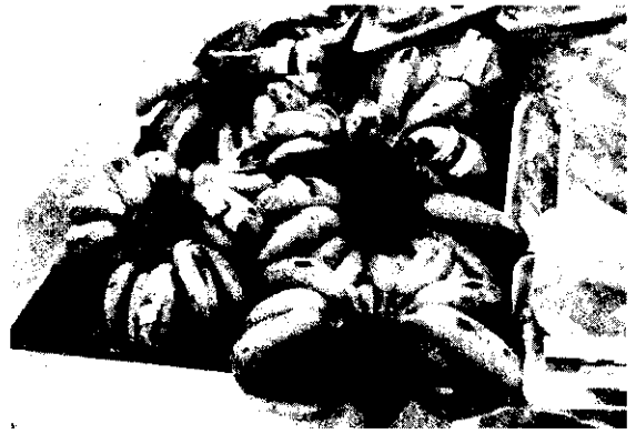
馬來西亞香蕉在新加坡市場零售

馬來西亞小粒種一年四季不斷成熟應市，大粒種每年有2~4月及6~8月兩個生產高峯。菲律賓芒果和泰國芒果每年自3月開始大量應市，一直到8月才結束。因此，本省芒果在6~8月生產時，很難打入東南亞市場。