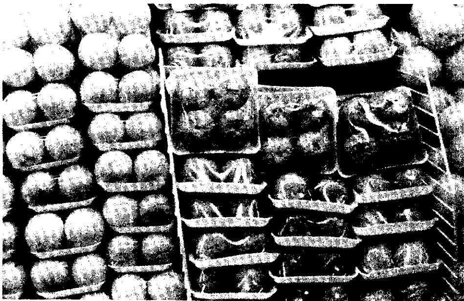
省產桶柑在新加坡市場零售