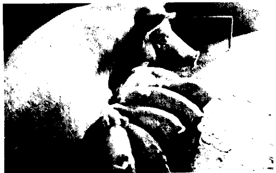
本病發生多以胎為單位

一般說來本病的經過相當快速，全身被滲出物膠着後3~5日就死亡。急性型表皮炎，皮膚變厚形成皺紋或龜裂，減食、脫水、衰弱，4~8日後死亡。亞急性型的病勢進展較緩慢，因此死亡率不高，但亦不容易恢復，多變成僵豬遭到淘汰。