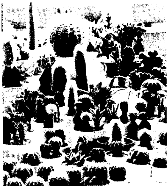
仙人掌(喜歡微酸性土壤)

修剪： 花卉生長至某一階段，必須經過修剪。普通修剪是指將植物的枝幹或根部，以及芽、蕾、花、葉的部分剪去或摘除。因此廣義的修剪為：摘心、摘