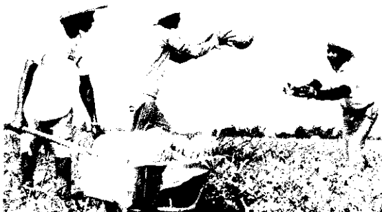
青年創業種西瓜

“輔導農村青年創業與改進農場經營貸款計畫”自民國69年開辦以來績效良好，深受一般農村青年歡迎，亦頗獲各界好評，至本年3月底止貸款累計1,303,613,198元，受惠農戶2,469人。