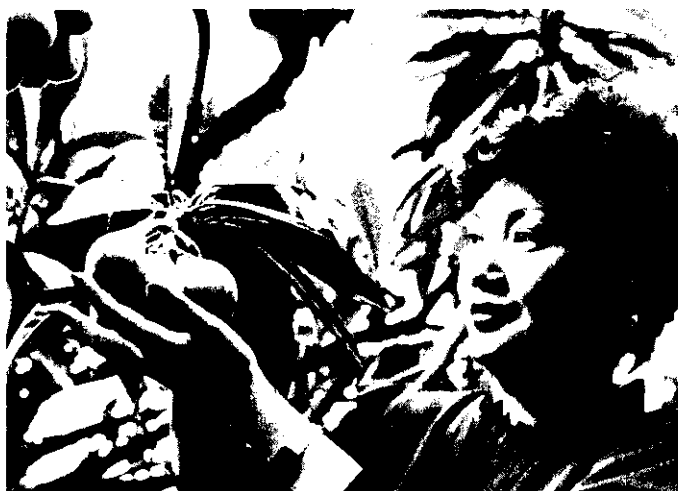
施肥的枇杷，大又甜。