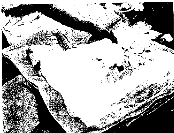
泰國波羅蜜(剝取可食部份放在冰塊上)

我們的外銷水果，除了香蕉與柑桔之外，每年外銷前並沒有好好的事先企畫，如果每一個市場的出貨量與秩序都不加以控制，價格會暴漲暴落，這一種現象絕非果農與商家之福。