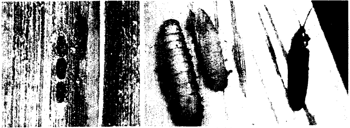
椰子扁金花虫(左)卵(中)幼虫(右)成虫