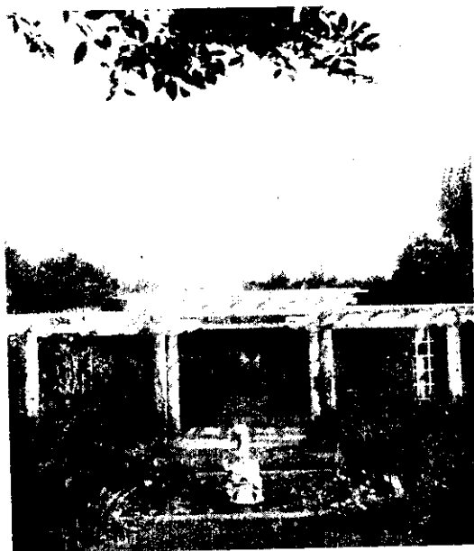
農家庭園設綠廊，可乘涼、觀賞、亦可充作葡萄架用。

6. 有些樹下、屋後較為陰暗的地方，要耐陰的花，像非洲鳳仙花、秋海棠、彩葉草、彩葉芋等，將可