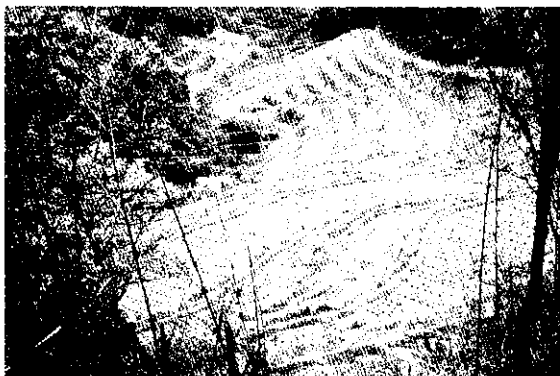
內湖的觀光草莓園，形成美麗的田園景觀。