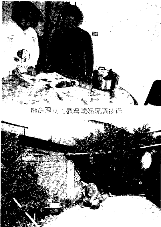
施章理女士教導媳婦烹調技巧