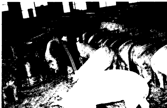
鍾蜜女士做豬隻疾病防治