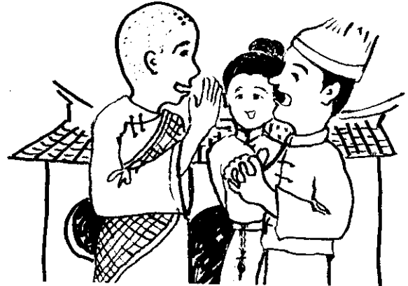
某天，有位遠方的和尚，告訴居民捉金龜的方法。

於是弟兄姊妹們合力拉網，那金龜好重好重，十個人累得汗流夾背，網繩纒一寸一寸的上昇。眼看快拉到井口了，老大忽然停止行動，邊擦汗邊言道：「先休息休息，讓我們來討論一下分配問題。我是長子，同時那五棵棕樹也是我找到的，按理以後金龜拉出來