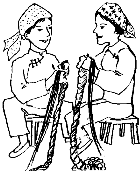
姊妹們各自剪下自己的頭髮，編織魚網。