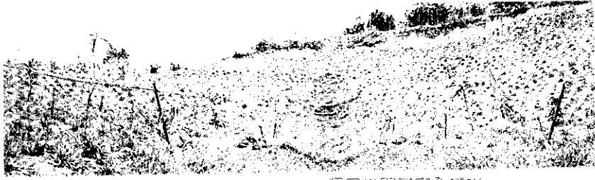
密植而喜草的速成草溝，2個月後即可安全排水。

壤有機質，以增進地力，進行全園植草覆蓋，同時加強山邊溝上下邊坡植草，溝面植草，及連絡道、農路路面及邊坡植草工作。等全園完密覆蓋後，即無需除草及中耕，這就是省工經營的重點所在，寓水土保持於「省工經營」之中，使水土保持更積極有效。