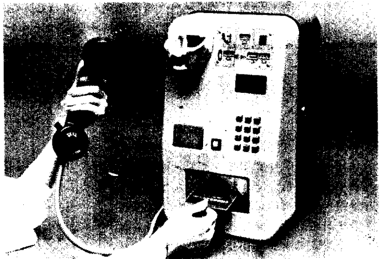
台灣北區電信管理局引進 15 部卡式公用電話機，7 月 1 日起試辦以卡通話。如果情況良好將全面裝用。