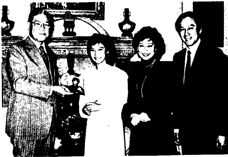
副總統李登輝接見回國訪問表演的華裔美籍 滑冰好手陳婷婷(左二)和她的父母

鄉鎮縣轄市公所組織規程準則」，規定轄區人口數較少但具農業型態的鄉鎮，准予設立農業課。由於此一修正，全省 319 個鄉鎮市設置農業課者，將由目前的 94 個增加為 178 個。