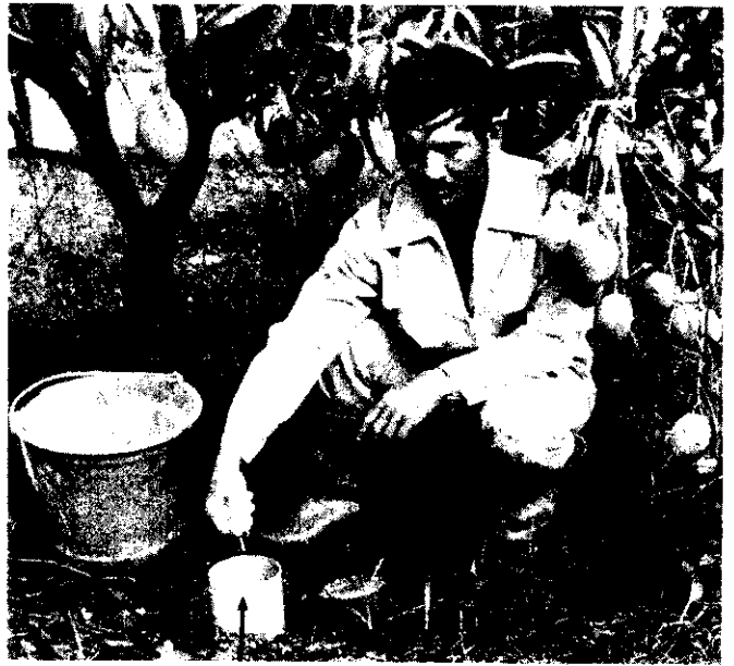
箭頭所指為進行塑膠管穴深層施肥法試驗