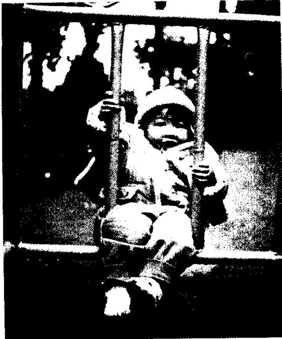
女孩男孩一樣好。