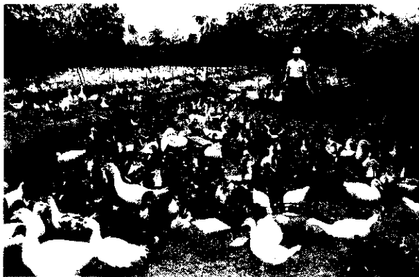
畜牧場廢污水不可擅自排入灌溉系統