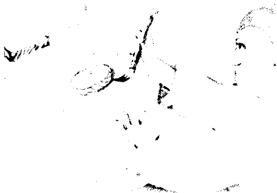
沒想到紙上的餅，竟變成真的餅了。

廉廣一驚，再三推拖。李縣令那兒肯放鬆，一再要求他畫一幅畫。廉廣被逼得沒法子，一時興起，便用出了五彩筆在牆上畫了一隊鬼兵，個個攜帶武器，彷彿要出征的樣子。席上坐的趙縣尉瞧見廉廣這一手本事，認為十分好玩，堅請廉廣也替他畫一幅，廉廣趁著酒意，在趙縣尉家的牆壁上也畫了一隊鬼兵，也是個個攜帶武器，祇是做準備迎敵的樣子。