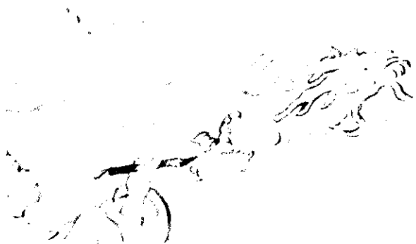
廉廣真的在衙門的壁上畫了一隻張牙舞爪的龍。