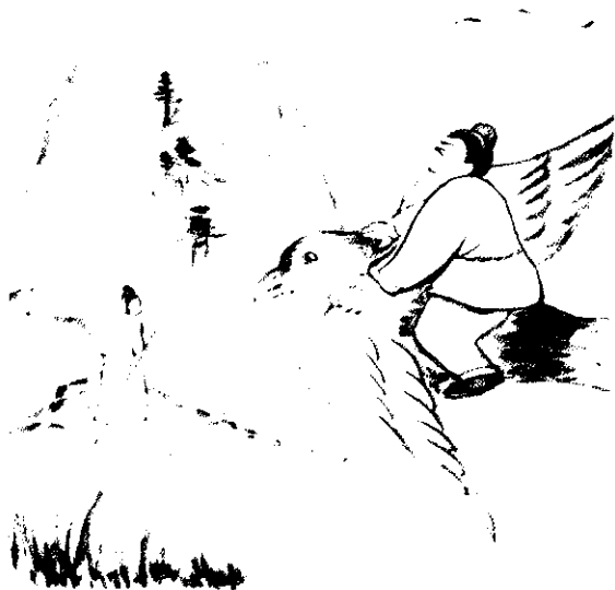
廉廣緊抱住大鳥的脖子，但聽耳旁一陣陣的風，呼呼地響。

過了片刻，他覺得風聲停止了，睜開眼睛一看，原來大鳥已載着他停在泰山山下。他跨下鳥背，抬頭一看，贈筆的那個陌生的人赫然站在他面前說：「我早已吩咐過你，要你好好把這支彩筆好好地藏著。誰教讓你讓外人知道，纔惹出這麼多的災難，我原意是讓你由這支筆，得到一些好處，沒想到你自巳跟自巳找麻煩，足見你沒有福氣，五彩筆還是還給我吧！」