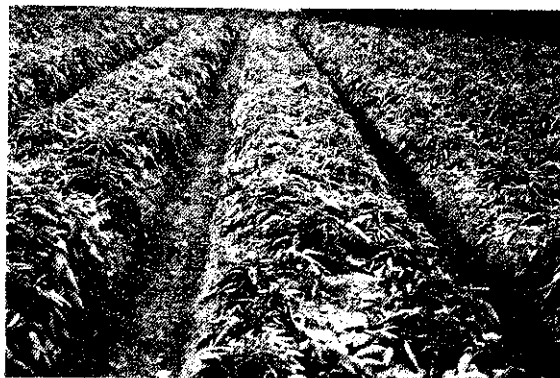
大葉品種生長後期生理性捲葉

馬鈴薯病毒種類雖然很多，但是並非每1種病毒皆能造成嚴重傷害，需視馬鈴薯品種和病毒種類而定。現在將本省常見的各不同病毒種類，依傳染性質的特性和目前栽培品種的關係綜合歸納簡述如下：