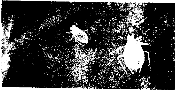
媒介病毒的主兇——蚜虫

(1) 蚜虫無法傳染，但接觸能傳染的病毒：有 Potato virus X (PVX)、Potato virus S (PVS) 兩種。對本省目前所栽培較多的品種如克尼伯又名大葉種 (Kennebec) 及卡麗納又名紅皮種 (Cardinal) 並不出現明顯病徵，看不出顯著影响。