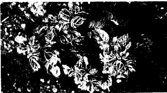
病毒複合感染的病株

馬鈴薯栽培容易，生長快，通常 90~120 天，視品種而定，就可採收。在這一段生長期間若沒有病毒發生，產量每分地可超過 3,000 公斤。如果種薯本身就帶有病毒，或生長初期感染病毒，產量約只有