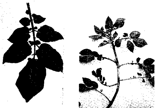
(左) 感染PVY(m)的病株 (右) 遭受蚜類為害的植株

作物生長，媒介病毒的昆蟲常年存在，所以馬鈴薯的栽培如同其他作物一樣，容易再受病毒侵入感染，而使產量驟降。栽培馬鈴薯，要如何才能避免或減少病毒的感染，及無病株（狂株）出現，才是栽培成功的要求。