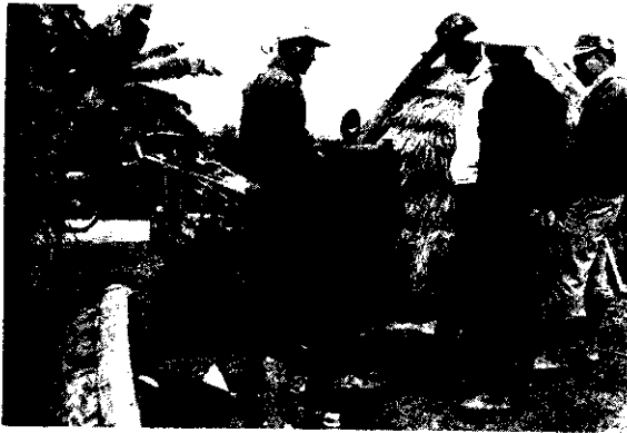
農機中心的工作人員，機動服務農友的情形。