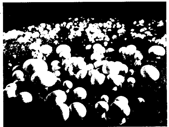
覆土處理妥善，可提高生產品質、增收單位產量。

3. 造成適當發菇環境 ：覆土材料一般是由礦物顆粒、有機殘餘物及充滿水或空氣的孔隙所組成的複雜基體。其養分雖不及堆肥的充足，但在潮濕時仍可以支持多種有益於洋菇生長的微生物繁生，洋菇的菌絲，在此也可以大量的生長，且洋菇子實體形成的各種