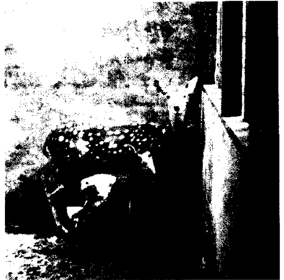
種鹿的進口，可以改良鹿種的品質。(黃貴豪)

那末，鹿茸是不是滯銷了呢？主要的是年來新進入的業者了解不夠，才會發生問題。其實鹿的數量並沒有飽和，鹿茸也並不太多。