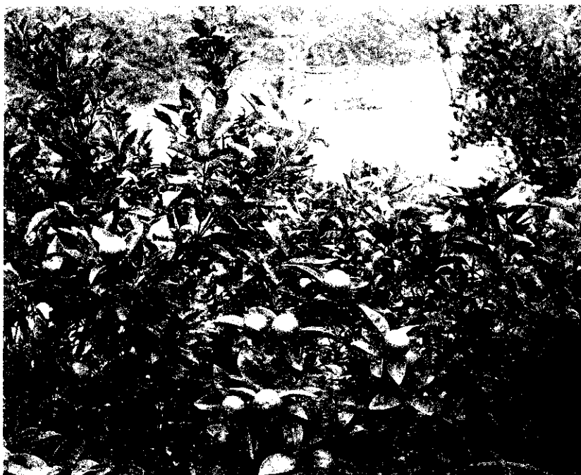
翡翠水庫邊的高接茂谷柑生長情形

及加州大學哈臣教授，茂谷果實及一般特性的記述如下：「果皮黃橙色；果表平滑光亮，有吻合果瓣的淺稜；果形扁圓；中型大小，果徑7~8公分；果高4.7~5.2公分；果基幾乎平坦，或僅有一寬1公分，深度1公厘的凹陷、果頂平坦一如果基者；萼片（即果蒂）甚小，淺裂，長僅1公厘；果皮薄，約1.2公厘，雖緊貼於果瓣上，但剝離甚易，除非採後經過數天，乃漸變剝皮困難；油胞小，圓形，色較果皮者為深，油胞與果表齊平；果軸半中空，橢圓形，15公厘×5公厘；果瓣11~12，瓢瓢被薄但甚堅韌；果肉橙色，質柔嫩，但不易融化，汁豐富而渣滓少；汁脆中等大小，紡錘狀；味濃郁而爽口；種子18~24個，小，圓帶尖型，10公厘×6公厘，胚白色；成熟季節中晚，在1~3月，掛樹性尚佳，略有