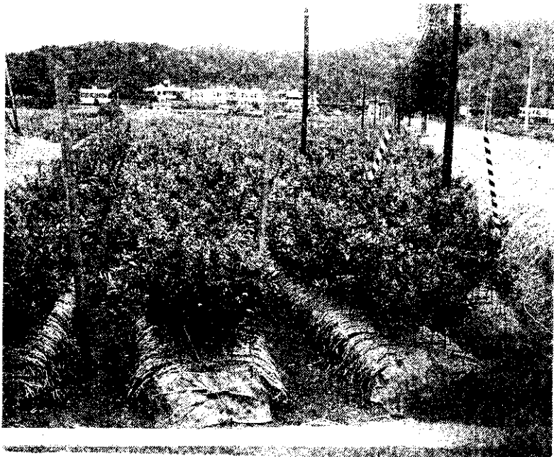
宜蘭員山鄉大湖路的茂谷柑苗圃

特別注意。簡言之，除注意足夠施肥的份量外，如逢豐產時，也宜加以適當的蔬果，乃可增加果實的大小及提高品質而避免茂谷柑植株的健康受損。