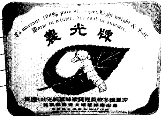
苗栗縣農會農光牌蠶絲被價格表