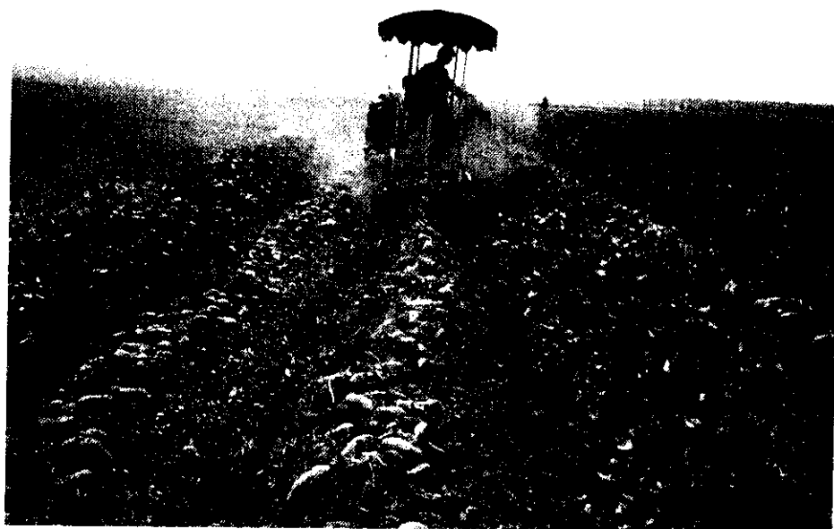
甘薯機械採收節省人工