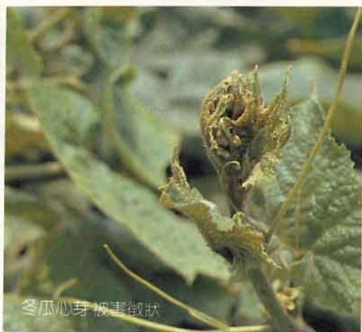
冬瓜心芽被害徵狀