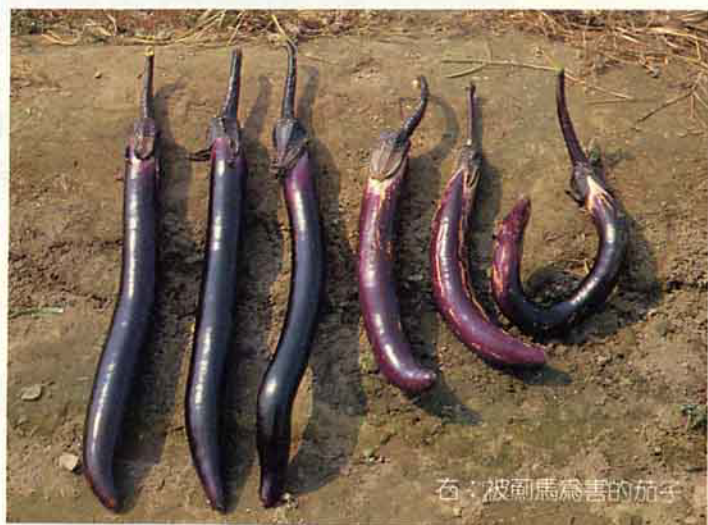
右：被薊馬為害的茄子