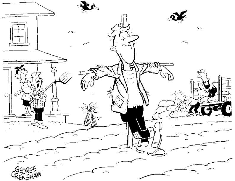
老蔡終於找到輕鬆的工作了