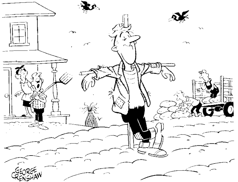
老蔡終於找到輕鬆的工作了