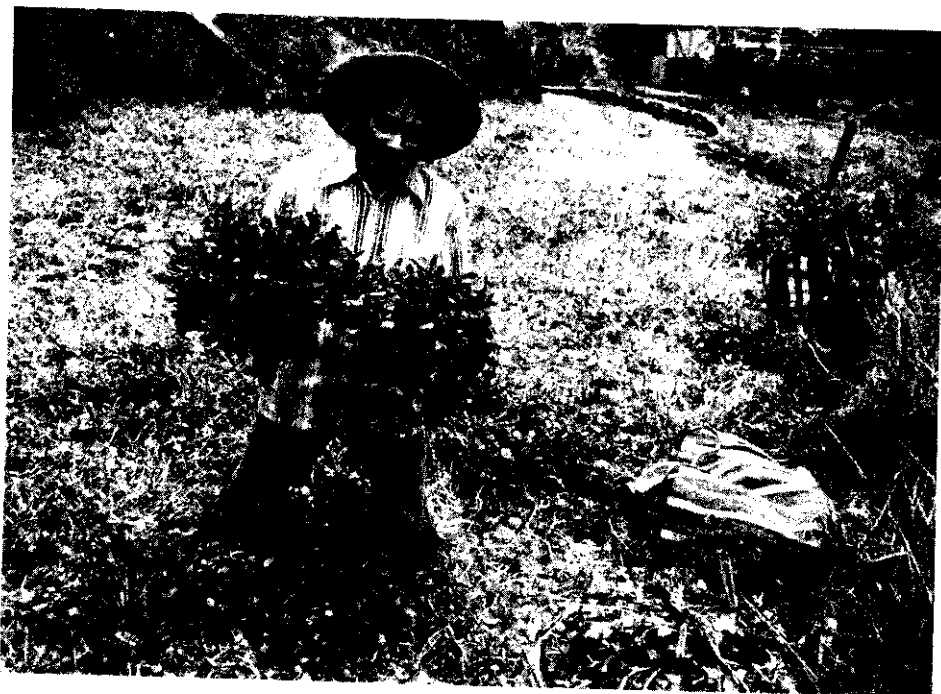
台北市士林區溪山里山坡梯田所栽培的水芥