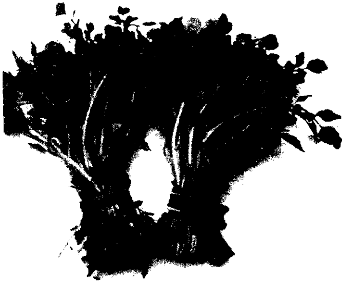
水芥(西洋菜、水薺菜)

水稻插秧一樣，取莖3~4株插一處，插入土2吋(5~7公分)，插植後1星期即發根生長，在生長期間宜施尿素稀釋2,000倍作追肥，以促進莖葉茂盛。